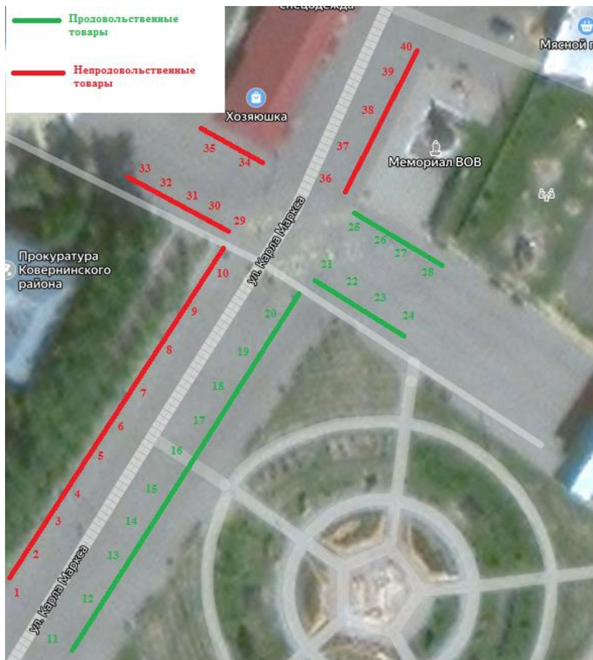
Схема размещения торговых мест на ярмарке